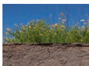
Erdwärmepumpe (integriert und wechselbar)